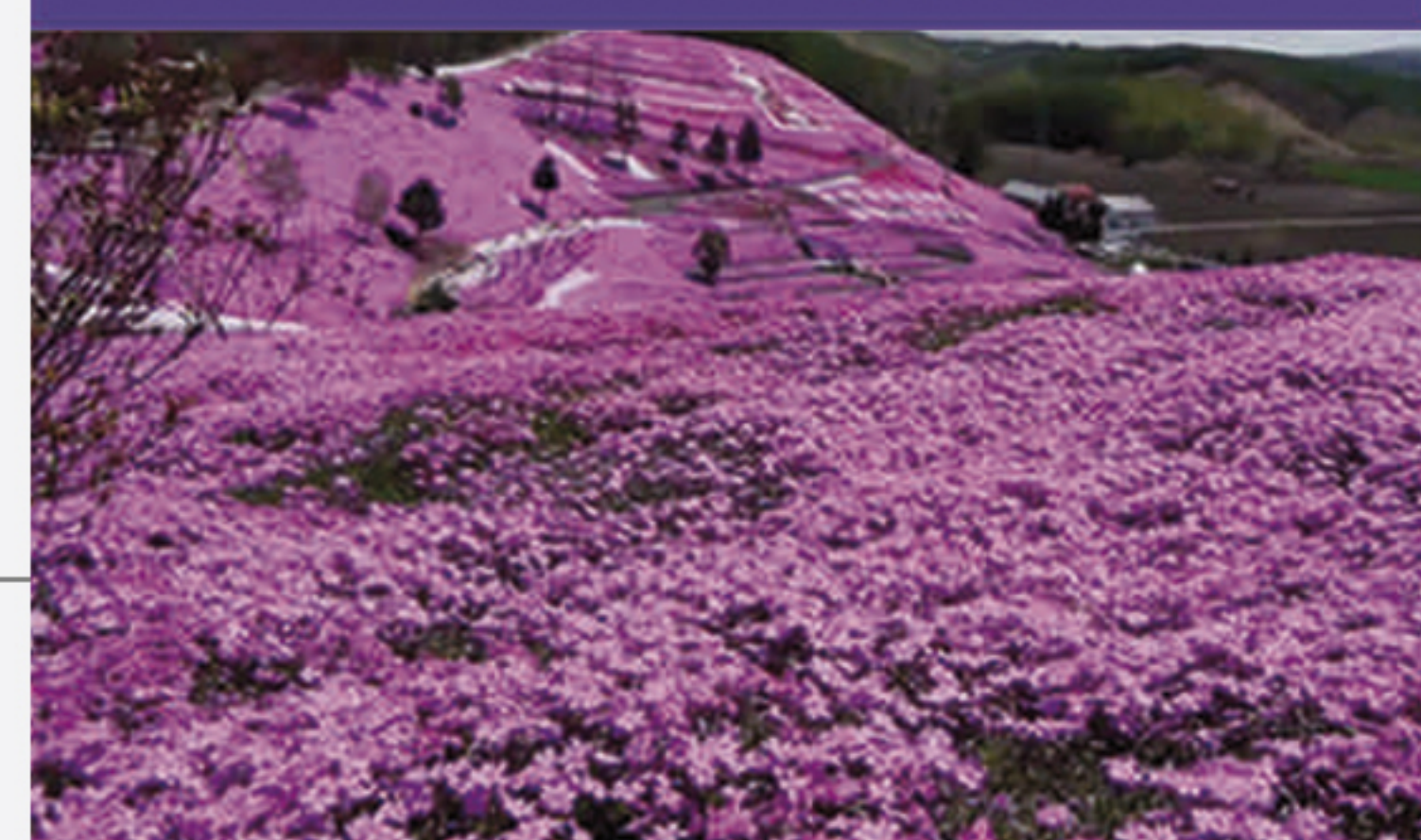
L8 TAKINOUE (JAPÓN)