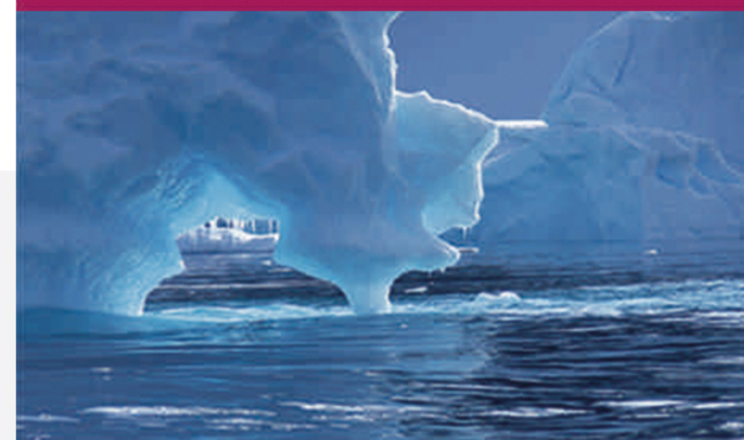
L6 ANTARTIDA (ANTARTIDA)