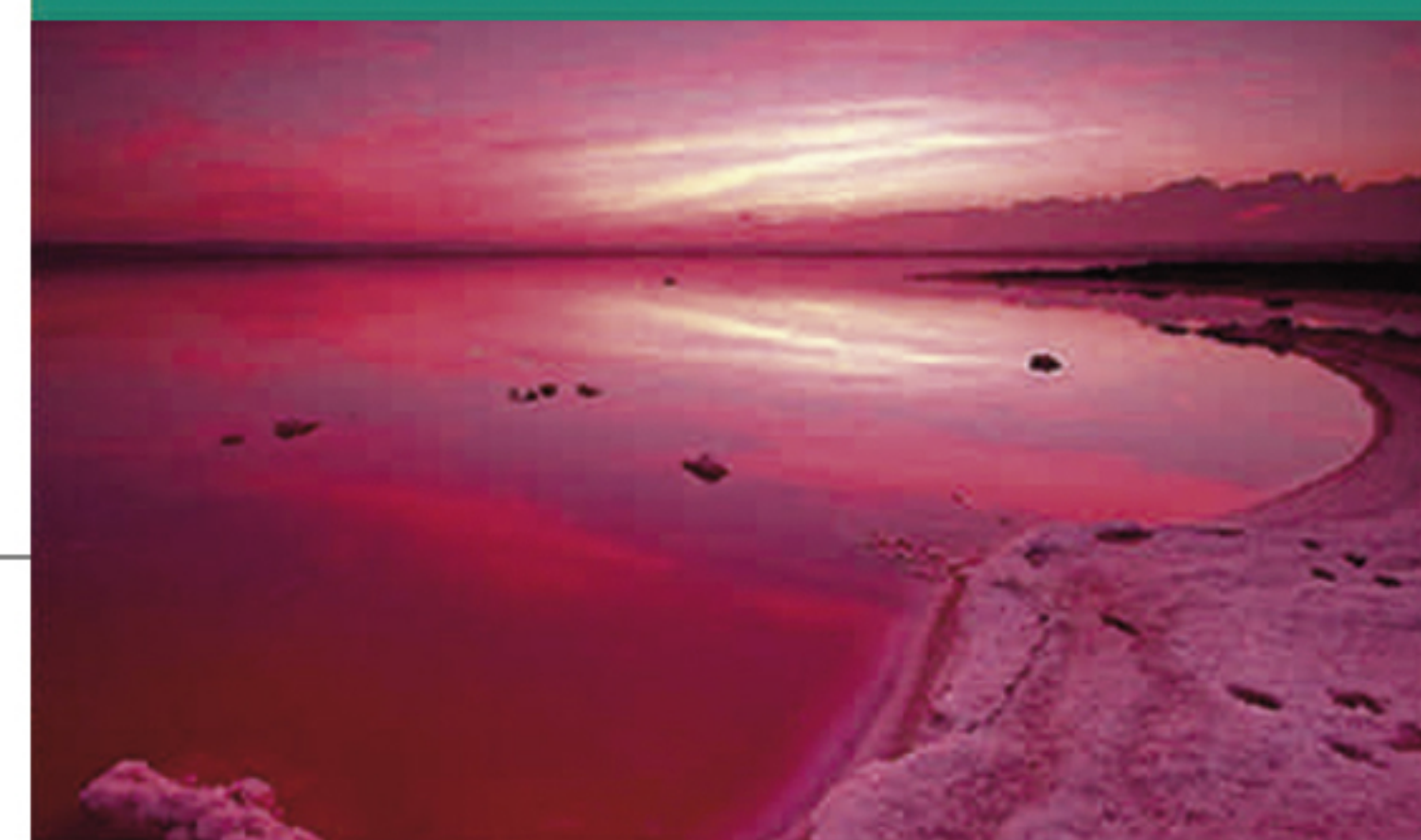
L5 SIVASH (RUSIA)