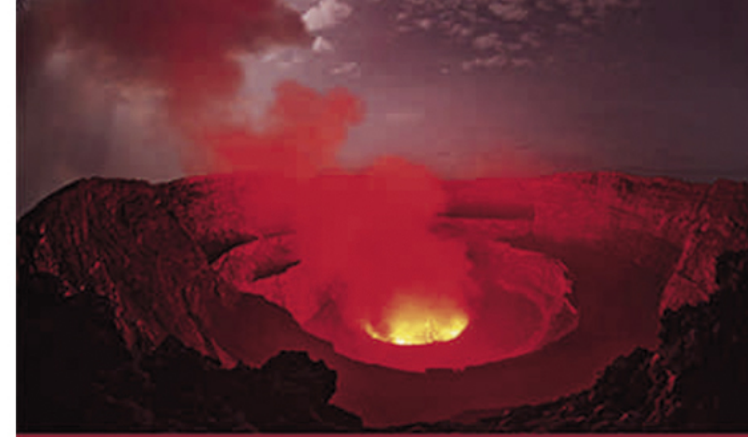
L1 KILAWEA (HAWAII)