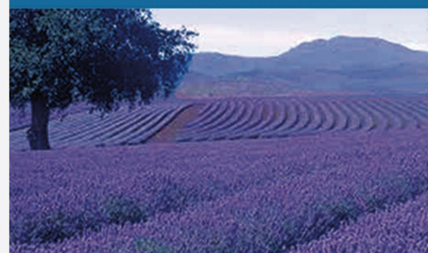
L7 PROVENZA (FRANCIA)