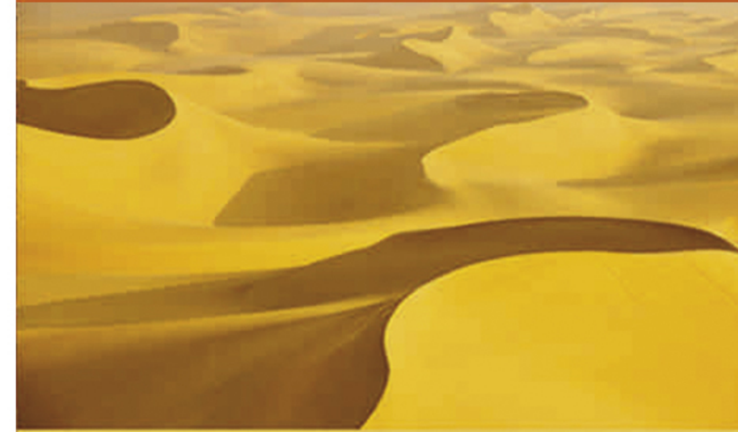
L3 SAHARA (AFRICA)