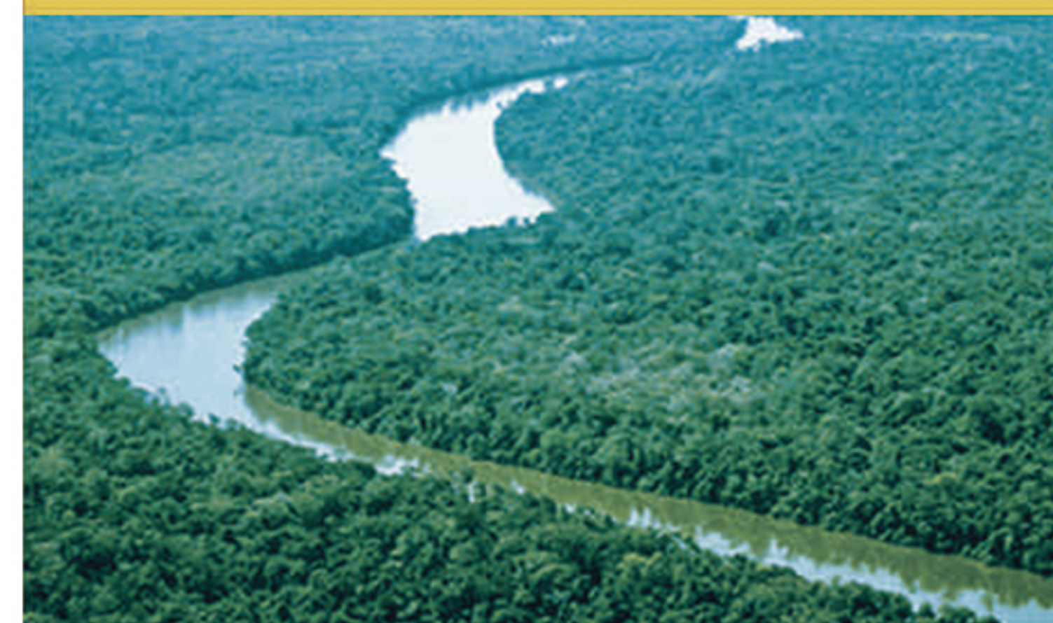
L4 AMAZONAS (BRASIL)