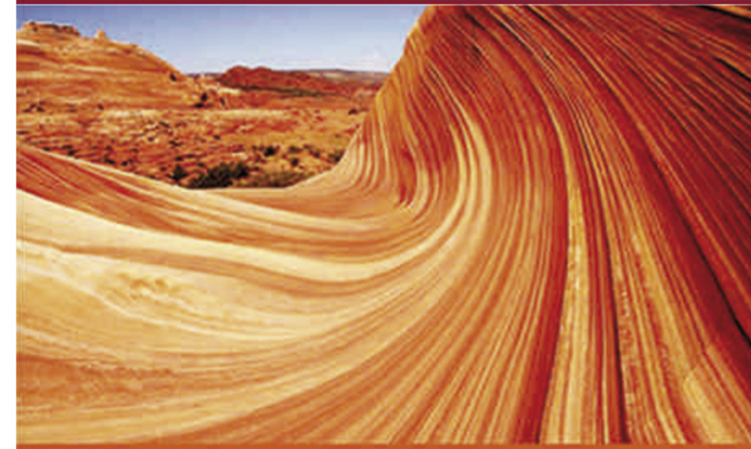
L2 ARIZONA (EEUU)